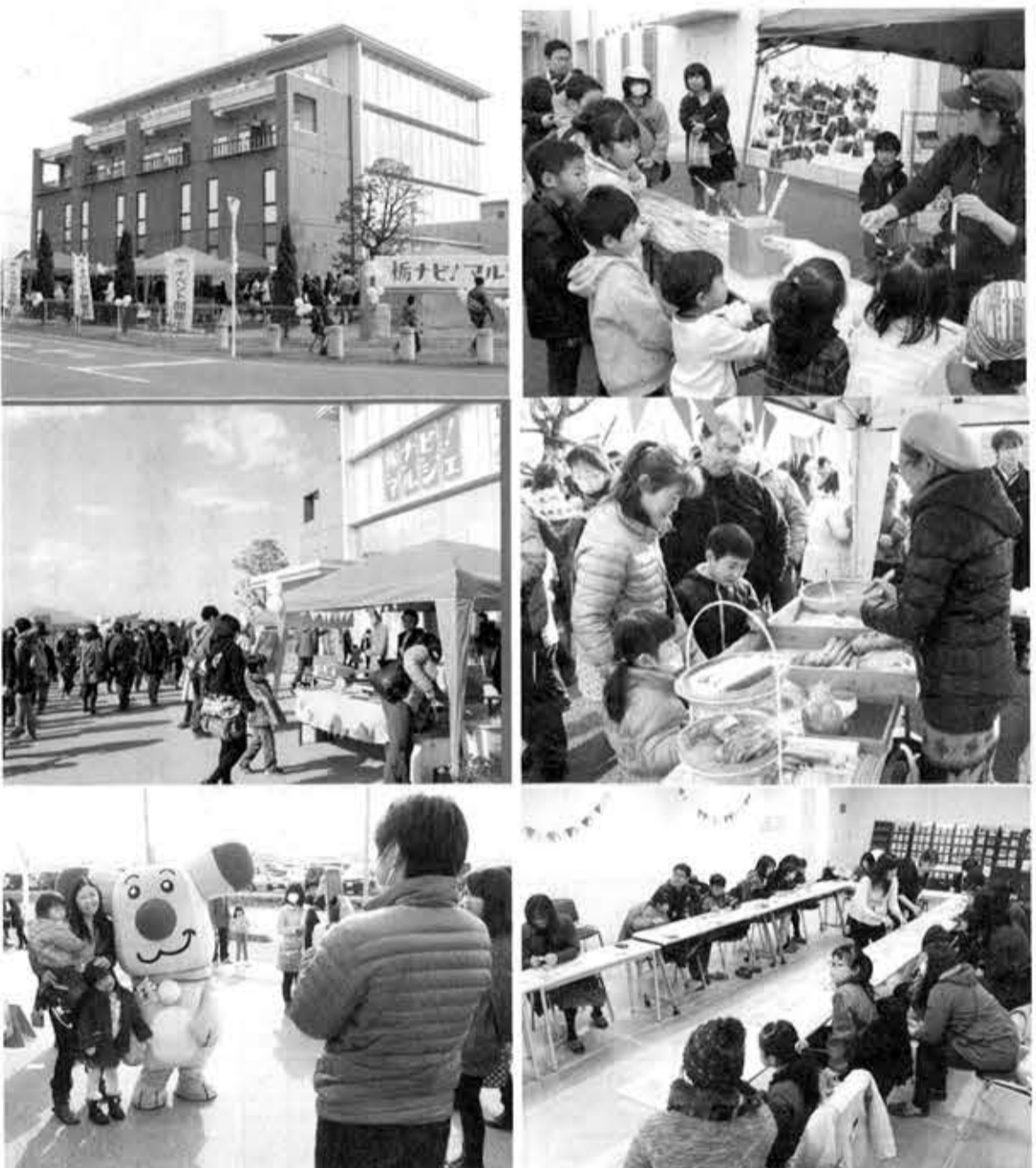
イベントに誘導する試みも。本社駐車場に7000人が詰めかけた